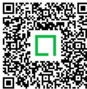
LINE Square SME group (using 17 checklist)