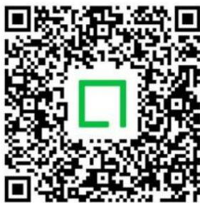
LINE Square Large Companies group (using 71 checklist)

Two LINE Square chat rooms are available to provide information and assist members.